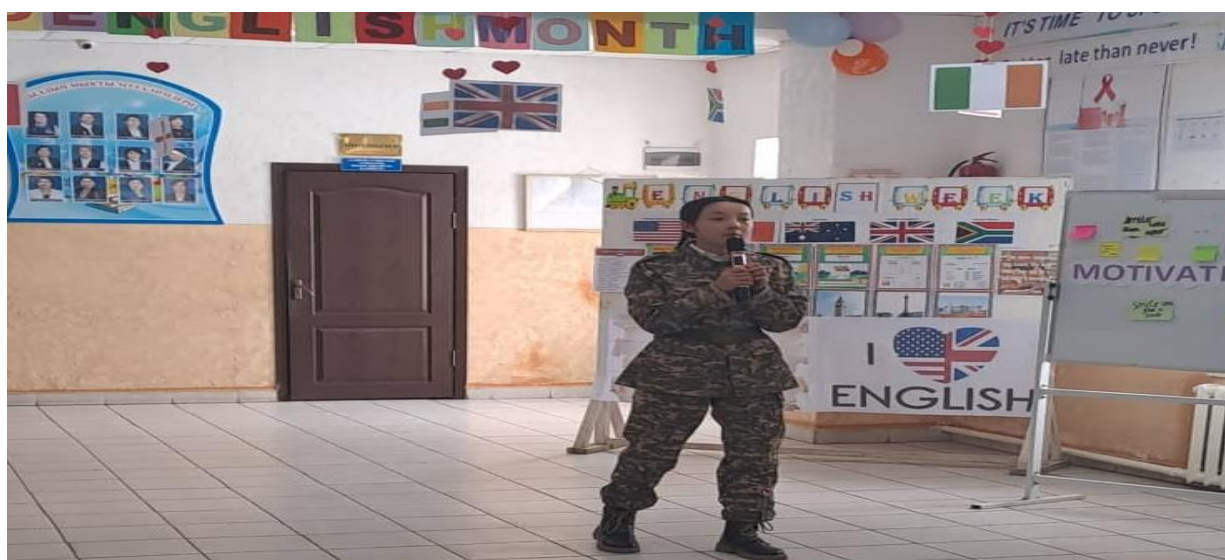
Райондук аскер комиссариаты тарабынан берилген тапшырмага катышкан жалпы окуучулар.